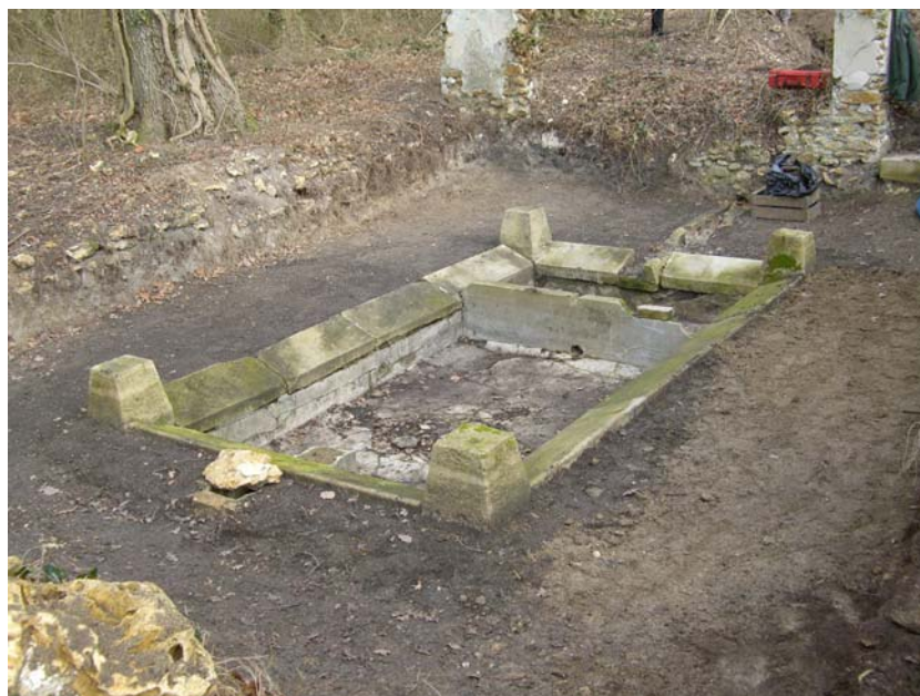
Le lavoir de Brezolles

Visites commentées de l'église de Vernouillet Circuit des lavoirs Circuit visite du parc des Buissons